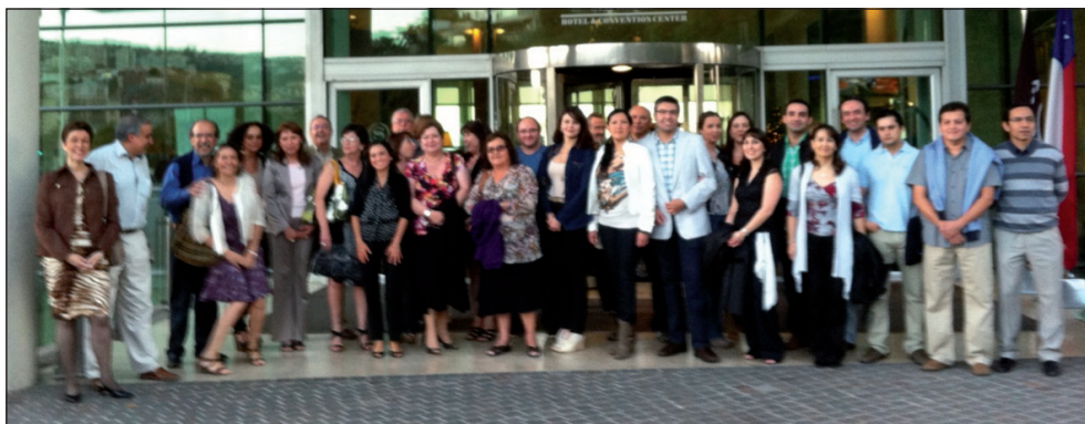
1 er Encuentro Ex-becados INT. Viña del Mar, 7 y 8 de diciembre de 2012.