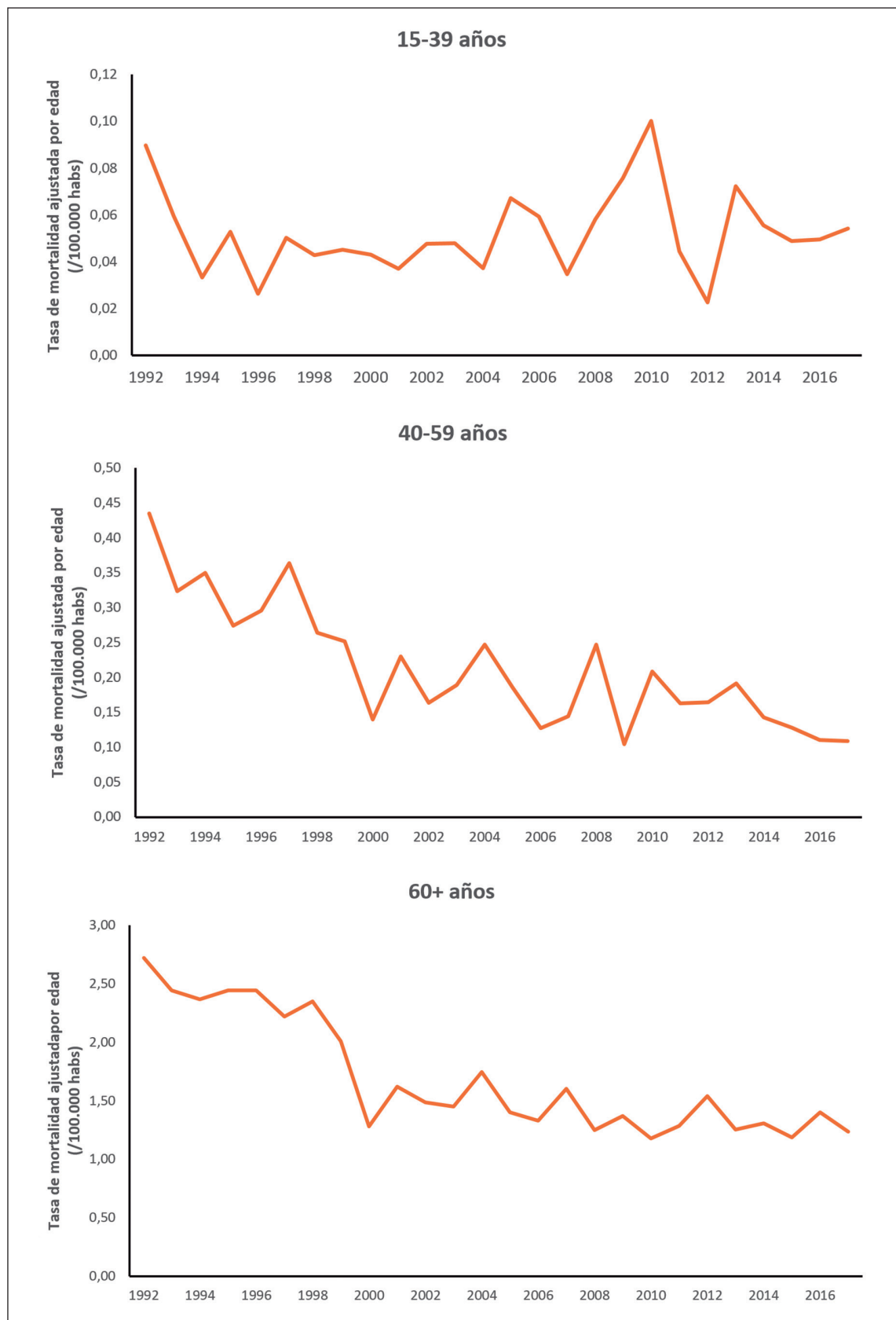
Figura 2. Tasa de mortalidad por asma bronquial crudas o brutas y ajustadas por edad según sexo y grupo de edad.